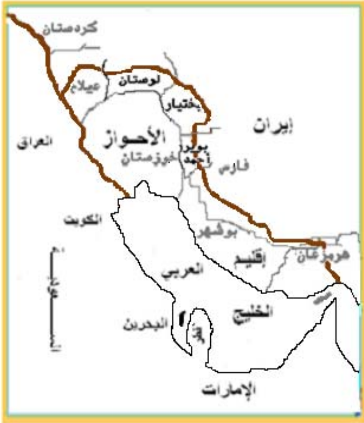
توزيع أراضي إقليم الأحواز العربي على عدد من المحافظات