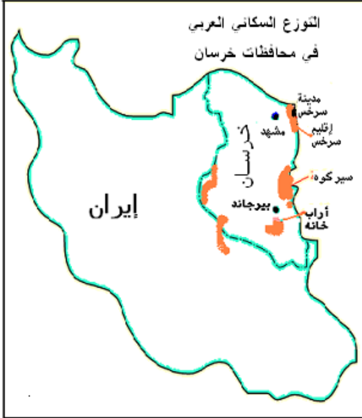
العرب في خراسان الإيرانية