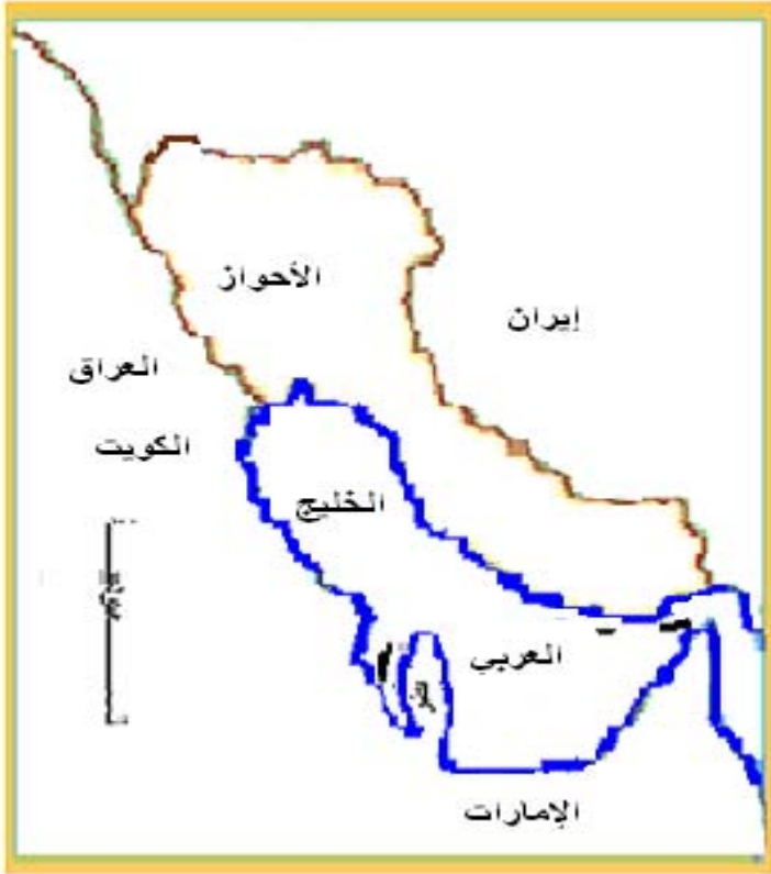
خارطة الحدود السياسية لإقليم الأحواز العربي