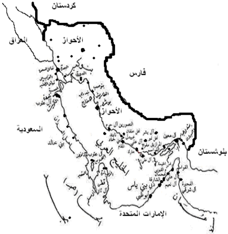
الإمارات العربية على الجانب الشرقي للخليج العربي